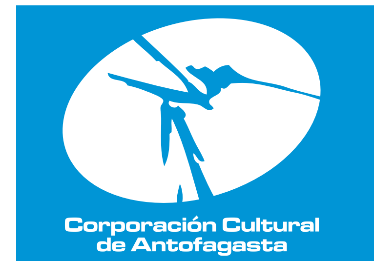
Versión blanco sobre fondo de color