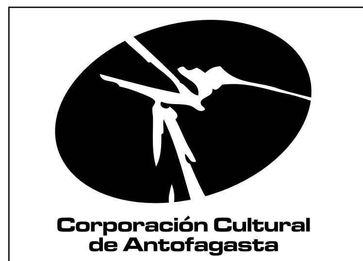
Versión negro sobre fondo blanco