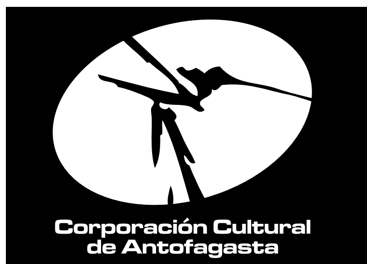
Versión blanco sobre fondo de color o negro